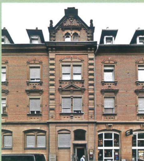
Sigismundstraße 21 (2012)